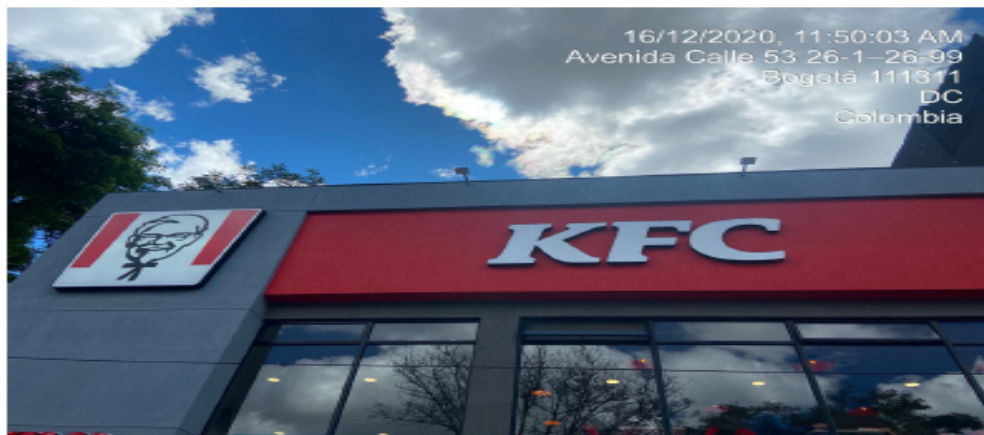
Fotografía aviso en fachada