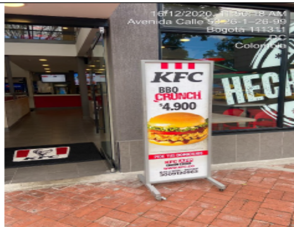
PEV espacio publico